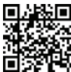
Video veřejné cvičení Mělčany z dronu

den se nesl ve znamení radosti z pohybu a přátelského setkávání. Na tento slet budeme ještě dlouho vzpomínat a už nyní se těšíme na další sokolské akce!